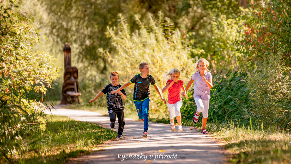
Vycházky v přírodě