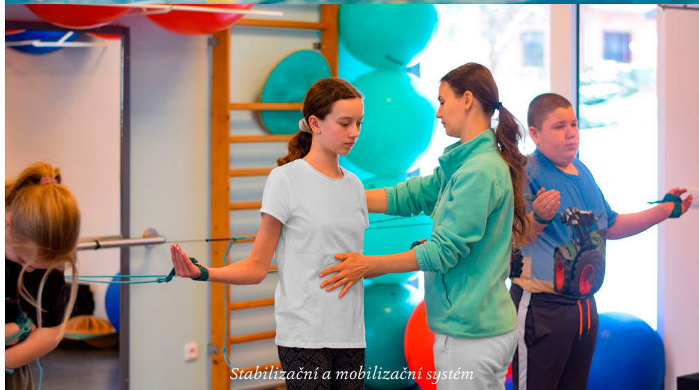
Stabilizační a mobilizační systém